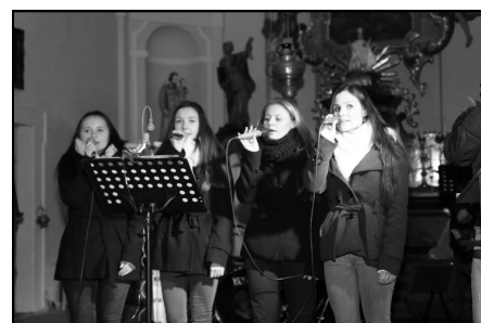
Dívčí sbor potěšil všechny návštěvníky vánočního koncertu v kostele

5. prosince - JSDH Mlázovice byla povolána ve 21.18h k požáru rodinného domu v obci Třtěnice. V době příjezdu na místo události se již dvě přízemní místnosti nacházely v plamelech. Na místě zasahovali kolegové z PS Jičín, kteří provedli prvotní zásah zařízením Cobra. Hašení velmi ztěžovalo obrovské množství odpadu, které se v domě vyskytovalo. Později začala také vybuchovat v domě uskladněná zábavná pyrotechnika. Na místě odchyceno více než 10 psů, které se podařilo uchránit před plameny, bohužel dalších více než 20 psů uhořelo. V domě také nalezeny zbraně a střelivo, předáno Policii ČR. Při velmi náročném zásahu mlázovičtí hasiči vynášeli věci z domu ven, kde probíhalo dohašení. Zároveň pomáhali se záchranou psů. Zásah probíhal v dýchací technice. Na místě zasahovala ještě JSDH Vysoké Veselí. Na základnu návrat až ve 2.00h. O události informovaly hlavní sdělovací prostředky, včetně tří celoplošných televizních stanic.