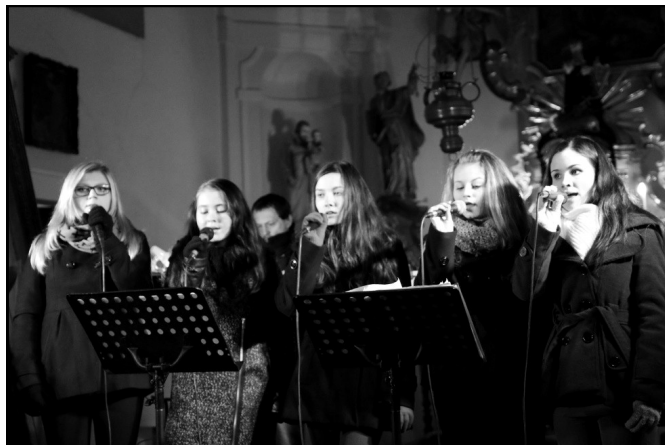
Divčí sbor předvedl vynikající pěvecké výkony, které vynikly v akusticky přívětivém presbytáři

Diváci si dlouhým potleskem vyspili ještě malý přídavek a pak už se všichni, naplnění povznášejícím pocitem, vydali do svých domovů. A právě o takových zážitcích by Vánoce měly být.