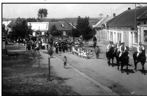
Průvod během I. Sjezdu rodáků (1928)