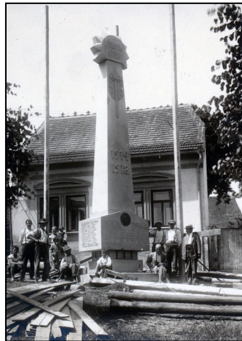
Před odhalením Pomníku padlých (vlastní odhalení proběhlo 8.7.1928)