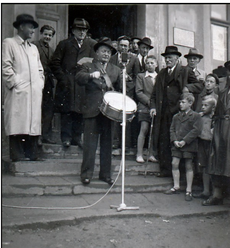
Loučení s obecním bubnem (17.7.1948). U příležitosti II. Sjezdu rodáků byl zahájen provoz obecního rozhlasu a bubeník mohl do důchodu.