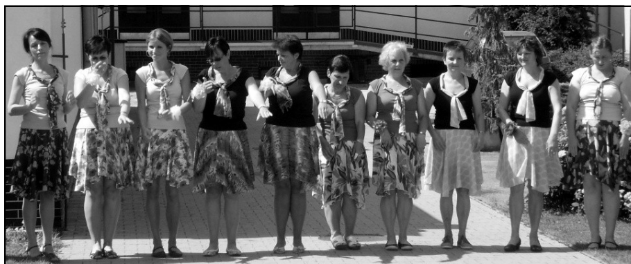
Soubor heřmanických žen během svého vystoupení