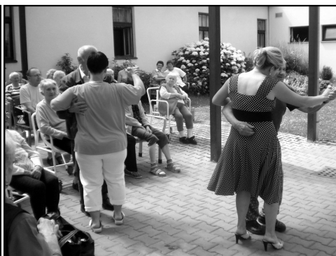
Vystoupení skupiny NouBand zvedlo mnohé ze židlí