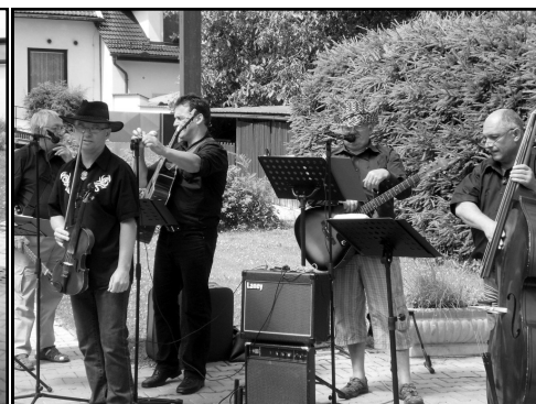
Vystoupení skupiny NouBand