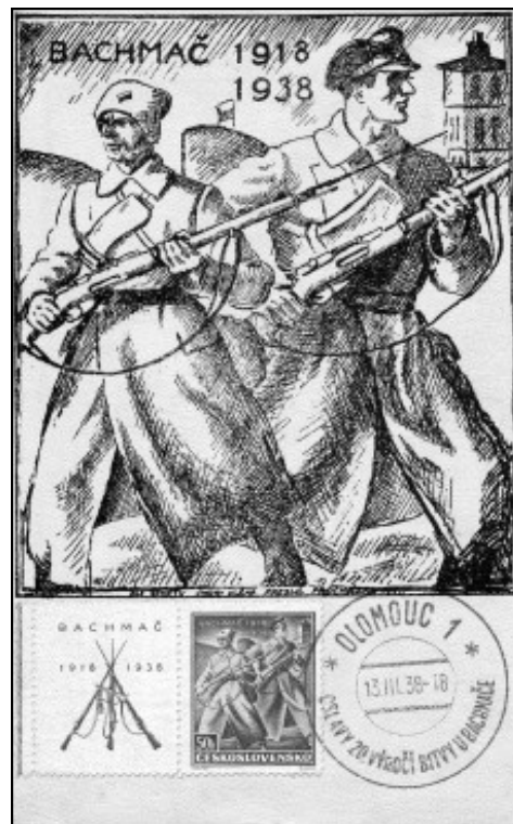
Originál pohlednice vydané k 20. výročí bitvy u Bachmače

neboli Agrostroji Jičín. Za životní štěstí považoval to, že tak strašné letecké nálety spojeneckých vojsk ve zdraví přežil. Říkal, že takové peklo na zemi nebylo snad ani možné překonat, ale jemu se to podařilo.