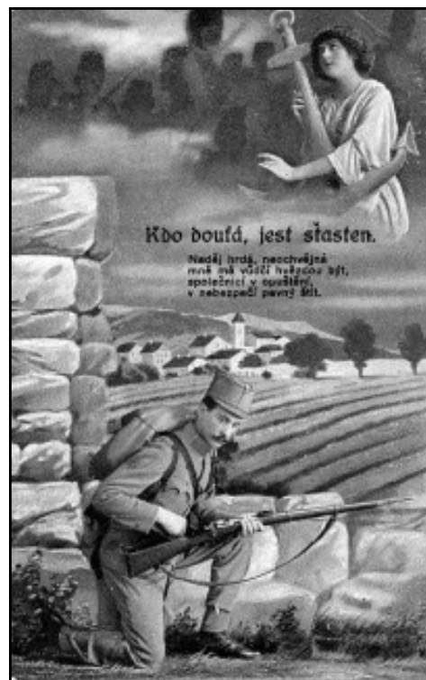
Takovéto pozdravy posílali legionáři z fronty domů