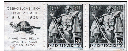
Pamětní aršík vydaný u příležitosti 20. výročí československé legie v Itálii (1918 - 1938)