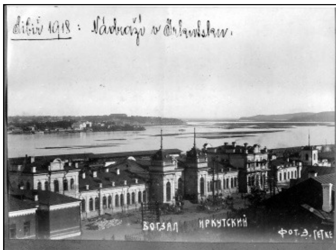
Nádraží v Irkutsku na Sibíři, 1918

Přišly chvíle ještě horší. Při dalším postupu byl schován za pláty lokomotivy a řídil boj. Nepřátelská kulka prorazila