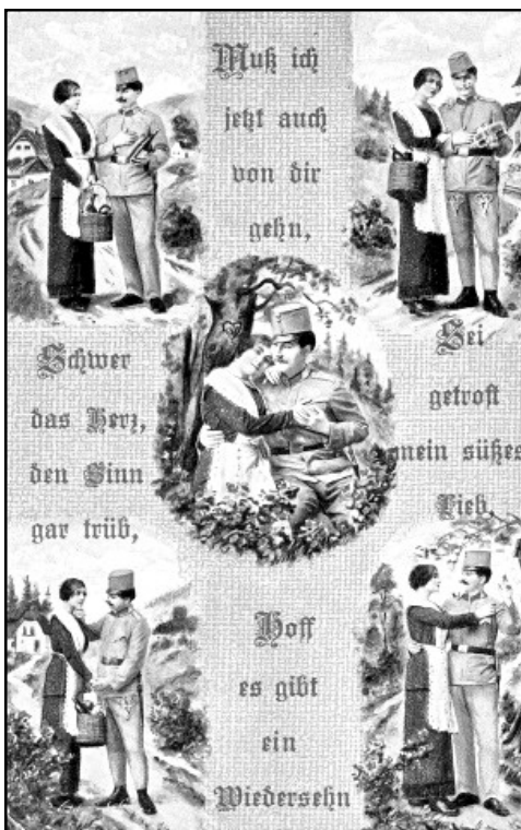
Ukázka dobové pohlednice z roku 1915, která ilustruje vsudypřítomné doteky války

Po tomto stálém stěhování se Ladislavovi přitížilo, proto lékař při své první návštěvě přišel právě k němu, neboť dle vyprávění sestry stále trpěl horečkami a měl velkou žízeň. Bylo u něho zjištěno, že má zvětšená játra a že je nutné mu dávat několikrát denně studené obklady, které mu udělaly dobře. Navečer se opět horečka zvýšila, takže s obavou očekával noc, jestli se mu ještě více nepřitíží. Sestra Stanislava mu stále chystala na stolek