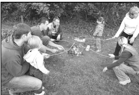
Opékání buřtů patří mezi nejoblíbenější činnosti na dětských akcích