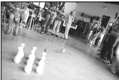
Své dovednosti i zápal pro hru předváděly děti při různých soutěžích

Poslední prázdninovou sobotu 28. srpna 2010 bylo na mlázovickém koupališti živo. Celé odpoledne zde probíhalo „Rozloučení s prázdninami“. Pro děti byl připraven zajímavý program, který nepřekazilo ani deštivé počasí. Děti školou povinné i mladší, si mohly vyzkoušet na hřišti střelbu z luku, za asistence rodiny Šimůnkových. Přimo na koupališti soutěžily v různých disciplínách.