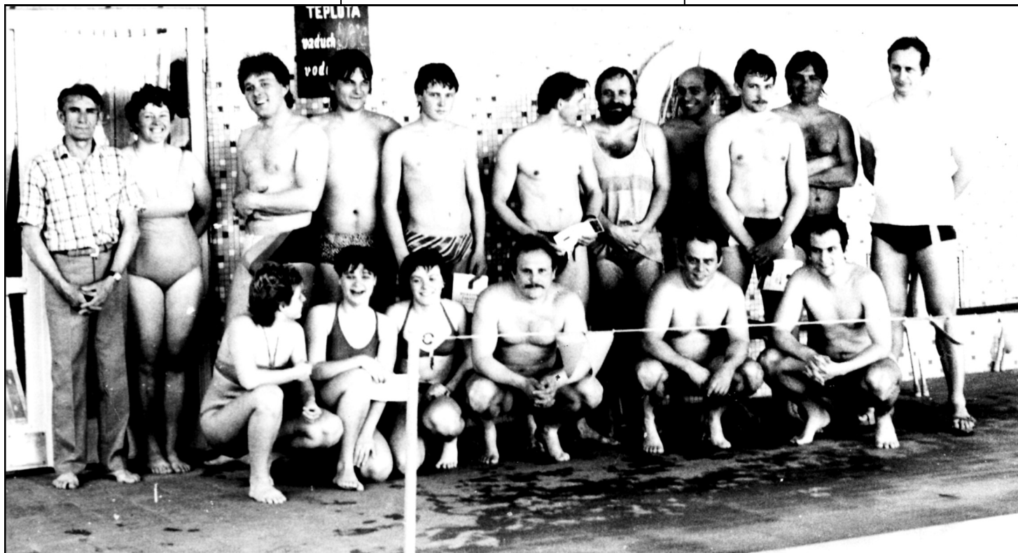
Devítičlenná výprava mlázovických plavců (klečí a stojí zleva). Ostatní plavci ze Zemědělského družstva Pecka a OVSDR. Předkolo zemědělské olympiády v roce 1988.

Naše sportovní výprava byla ubytována ve velmi prosperujícím druž-