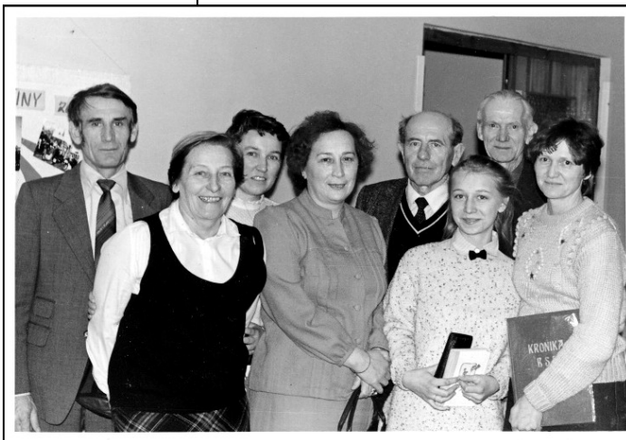
Společná fotografie Mlázováků po besedě s manželi Zátopkovými na sále Radnice v roce 1987

mistry sportu Danou a Emilem Zátopkovými. Toto přátelské setkání připravila Tělovýchovná jednota na sobotu 1. března