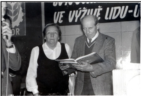
Dana a Emil Zátopkovi v Mlázovicích v roce 1987

Před samotným vystoupením v Praze proběhlo okrskové cvičení v Ostroměří za sokolovnou a v měsíci květnu se konala okresní spartakiáda v Hořicích. Cvičení jako o předchozích spartakiádách se ve velkém počtu zúčastnila i naše mládež. TJ Předvoj obdržela od okresního štábu v Jičíně diplom za aktivní podíl na Československé spartakiádě.