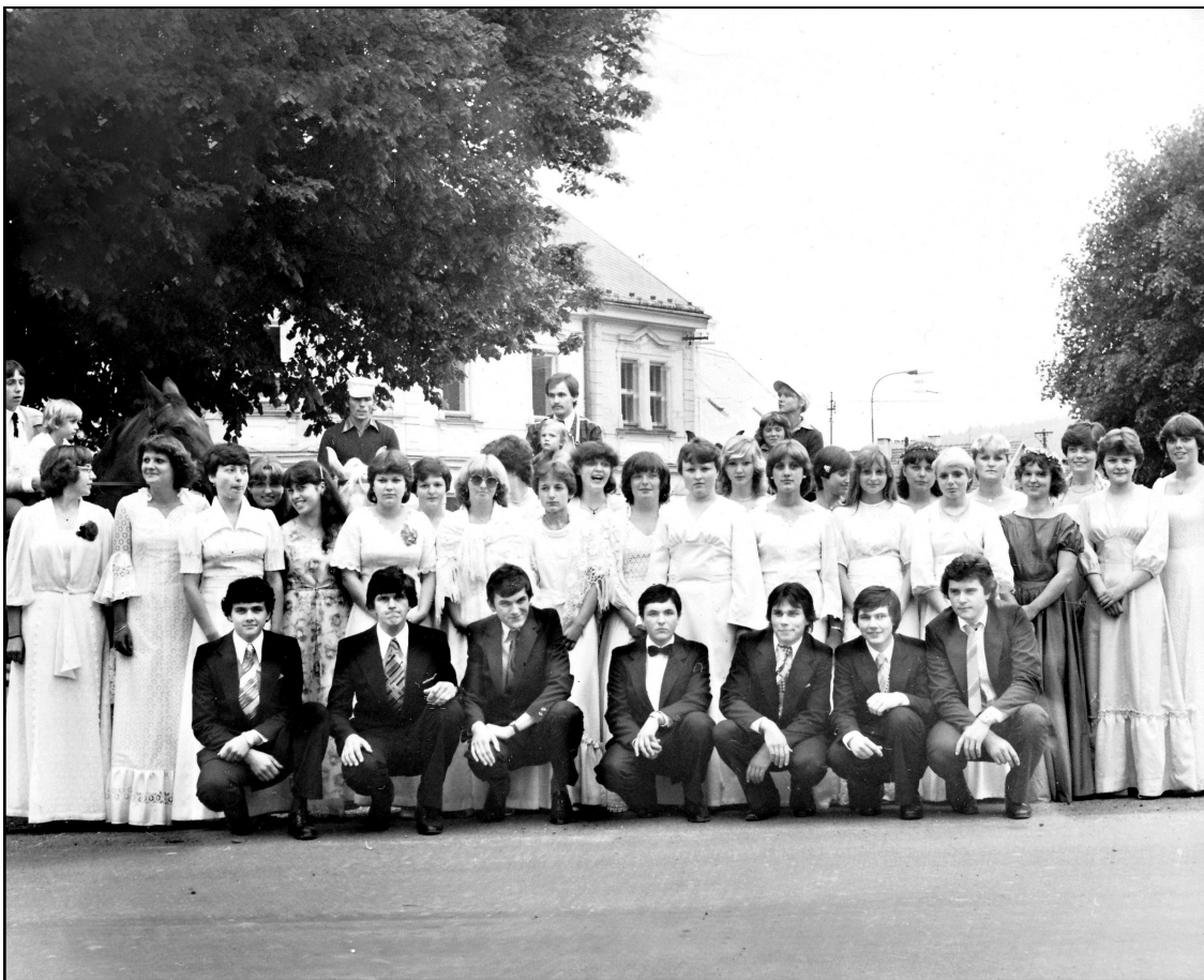
Tradiční mlázovické máje v roce 1980, pořádáné TJ Sokol

Z kulturních akcí je třeba vyzvednout tradiční máje s vyváděním děvčat a průvodem po obci za doprovodu kapely, následnou odpolední zábavou a večerní májovou veselicí. Máje se v tomto desetiletí konaly ještě v letech 1980 - 1982. Tato činnost si získala oblibu v širokém okolí a stala se pravidelným dostaveníčkem mnoha přátel této zábavy. V roce 1971 až do uváděného roku 1982, kdy se máje bohužel konaly naposledy, proběhlo bez jediné absence plných dvanáct ročníků a v žádném případě jsme si nepřipouštěli, že tato jarní úspěšná a vel-