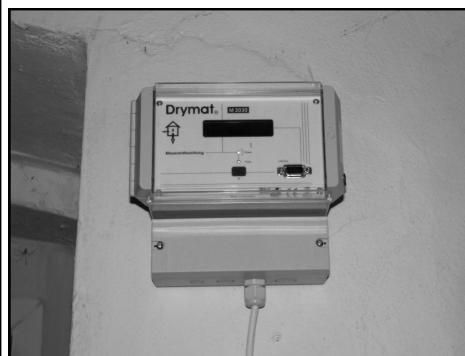
Speciální přístroj DRYMAT vysušující vlhké a zasolené zdivo

Pokud bude vše fungovat, jak je deklarováno, hodlá ho obec využít i na jiné problematické objekty, které vlastní.