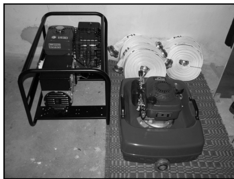
Mlázovičtí hasiči již mají k dispozici špičkovou elektrocentrálu a plovoucí čerpadlo