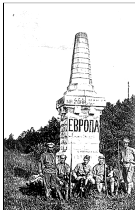
Monument na magistrále sděluje, že zde za Uralem Evropa již skončila. Začíná Asie a chladná Sibiř.

Než k této šťastné události došlo, je potřeba vrátit se k dalším podrobnostem nazpět. Pochod z Dárnice v plné polní a navíc se zásobami konzerv, cukru, mouky a dalšími věcmi ze skladů, které legionáři střežili, nebyl jednoduchý. Navíc s blížícím se jarem byly cesty ve dne rozbahněné a v noci naopak zamrzlé. Šlo se po železniční trati, cestách a polích kolem ní, aby nezabloudili. Prvním dlouhým úsekem pěší cesty byla železniční stanice v městečku Břežany. Zde si vypůjčili jeden prázdný vagón stojící na kolejích. Po naložení všech těžkých zavazadel a chůze neschopných vojáků vagón dotlačili na nádraží Perjaslav, a tak dosáhli svého cíle značně rychlejším tempem. Za pozornost stojí i zmínka o tom, jak se na přechod Čechoslováků přes ukrajinské vesnice dívalo místní obyvatelstvo. Z větší části to bylo s přátelským, ale místy i s nevráživým pohledem, netušíce, že