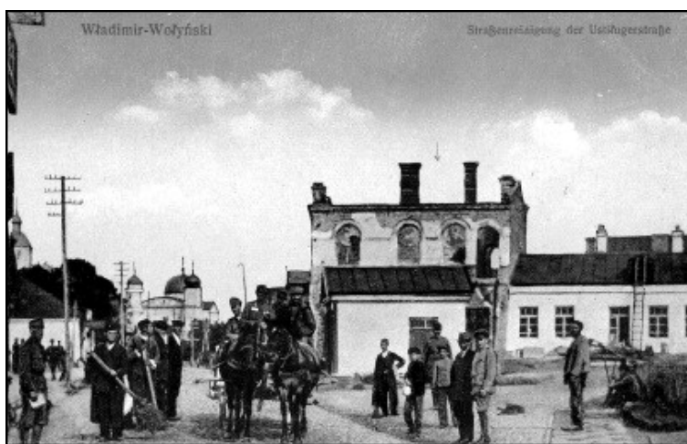
Vladimír Volyňský - město odkud naši vojáci nastupovali do boje za Rakousko - Uherskou armádu naposledy

Po vystoupení celý prapor zamířil z nádraží na dokonale vyspravenou cestu, která měla sloužit hlavně pro těžké náklady a děla putující přímo na frontovou linii. Pěší pochod vojska směřoval močálovitou krajinou, proti němu procházely spousty ruských zajatců, kteří pracovali na opravě silnice a železniční tratě. V této oblasti kolem Vladimíru utrpěli Rusové porážku, přičemž zemřelo také značné množství rakousko-uherských vojáků, včetně Čechů. Na dvou vojenských hřbitovech ve městě se nachází několik samostatných i společných hrobů s označením jmen českých vojáků, kteří zahynuli v boji nebo zemřeli v nemocnici na následky zranění či útrap války.