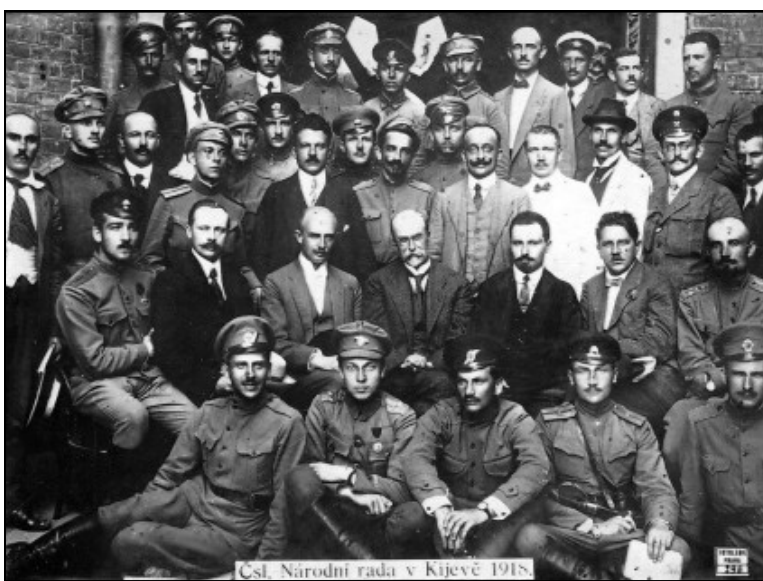
Česká národní rada v čele s T.G. Masarykem na setkání s vedením legií v Kyjevě, v roce 1918. Masaryk strávil v Rusku téměř rok od jara 1917 do jara 1918. Díky jeho usilovné práci vznikl z legionářů armádní sbor na Rusi.