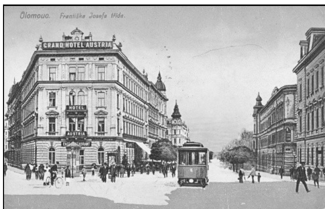
Město Olomouc bylo, ve většině případů, při železniční přepravě našeho vojska na ruskou frontu poslední zastávkou na našem území. To potvrzuje i pisatel vyobrazeného pohledu, ve kterém sděluje: „Jedeme asi do Ruska, ale raději kdyby sme jeli do Čech domů“. Datováno 28.7.1917.