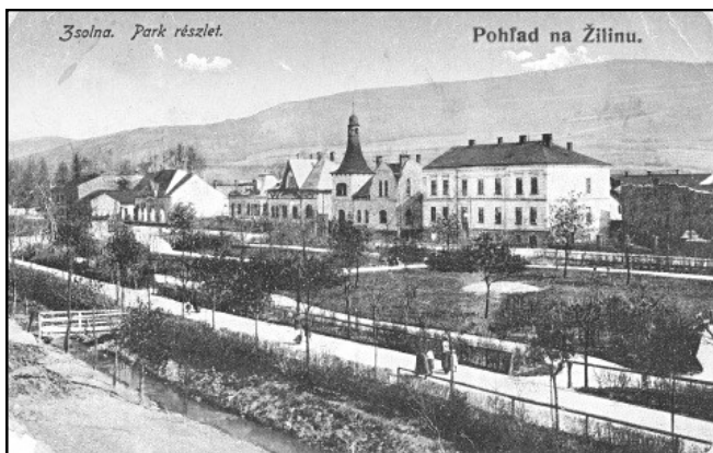
Na Slovensku mohlo Ladislavu Johnovi pomoci i zdravotní zařízení v Rimavské Sobotě. Měl dobré přátele ze Žiliny, odkud v roce 1917 odjížděl přímo na frontovou linii. Pohled na město Žilina přibližně z roku 1918 (pohled je odeslán v roce 1919).