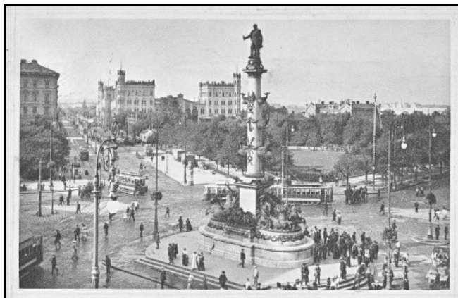
Krásné město Vídeň, ve kterém monarchové a chtiví válečníci naplánovali a spustili peklo na zemi v podobě I. světové války, která se více či méně dotkla obyvatel desítek zemí světa.

Druhý den ráno zastavili v dosti velké stanici, kde z okna četli na nádražní budově název Miškolec. Po zastávce