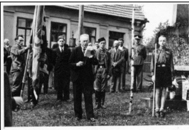
13. května 1945. Oslava vítězství po 2 světové válce na Náměstí.