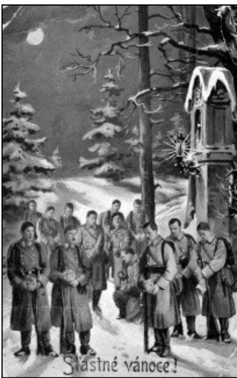
Každodenní strádání na vojně nezpůsobovalo vojákům takový smutek a utrpení, jako tomu bylo v období vánočních svátků. Stesk po domově a rodinách byl silnější než nejpevnější vůle.